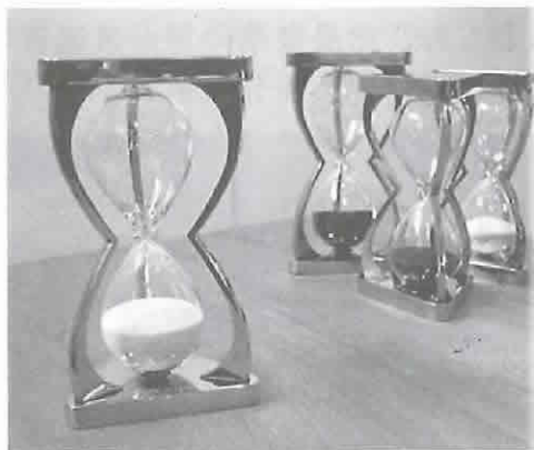
同社で製造する砂時計